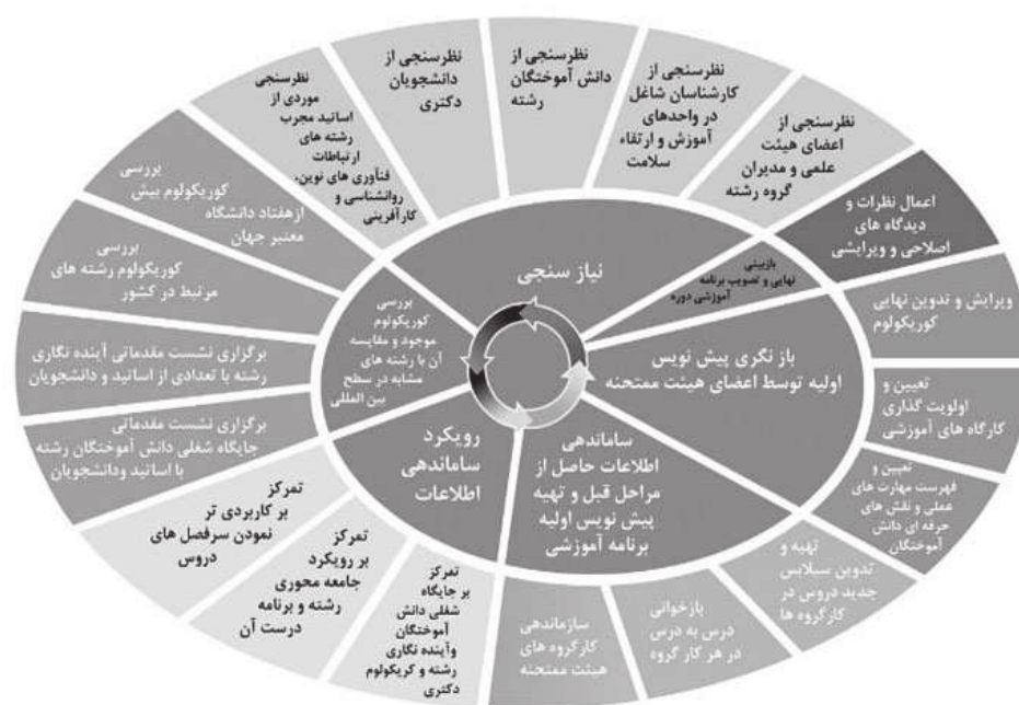
شکل شماره (۲): فرایند بازنگری برنامه‌های درسی در آموزش علوم پایه، بهداشت و تخصصی

هشت یا ارزشیابی برنامه صورت می‌گیرد و در صورت لزوم اصلاحات اعمال می‌شود.