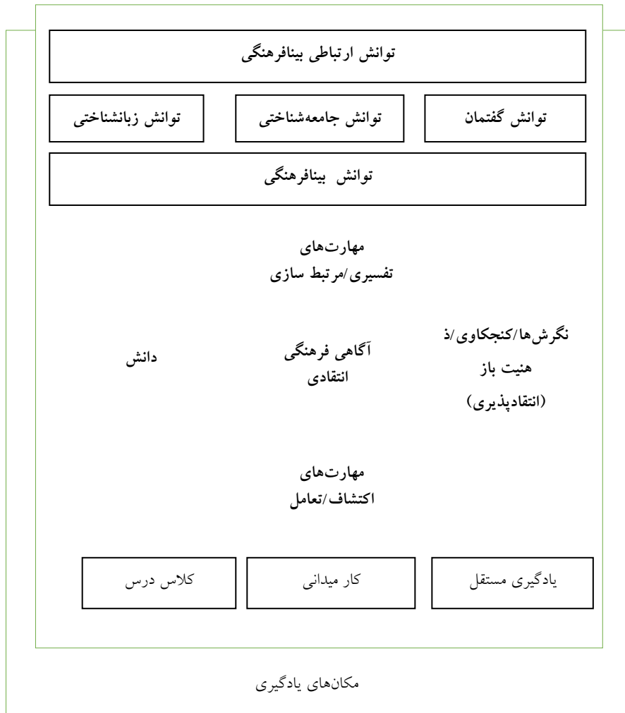
شکل (۱) مدل توانش ارتباطی بین‌فرهنگی (بایرام، ۲۰۰۹، ۳۲۳)

شکل (۱) عناصر تشکیل‌دهنده مدل توانش ارتباطی بین‌فرهنگی (بایرام، ۲۰۰۹، ۳۲۳) را نشان می‌دهد.