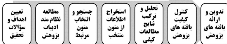
شکل ۱: مراحل هفتگانه الگوی فراترکیب ساندوسکی و باروسو (۲۰۰۷)

روش فراترکیب ۱ ، یکی از مجموع روش‌های فرامطالعه ۲ است. توضیح آن که روش فرامطالعه به معنای بررسی، ترکیب و تحلیل نظام‌مند پژوهش‌های گذشته و یکی از روش‌های تحقیق کیفی پرکاربرد است که امروزه توسط پژوهشگران و مدیران، بسیار مورد توجه و استفاده قرار گرفته است. روش فرامطالعه در حقیقت مشتمل بر چهار روش: الف) فراتحلیل ۳ ، ب) فراروش ۴ ، ج) فراترکیب ۵ و د) فراترکیب تعریف می‌گردد (Bench and Day, 2010). روش فراترکیب یا متاسنتز یک روش تحقیق کیفی است که به پژوهش درباره پژوهش‌های دیگر یا به تعبیری دیگر، به ارزشیابی تحقیقات گذشته می‌پردازد و از آن، تحت عنوان ارزشیابی ارزشیابی‌ها نیز یاد می‌شود. در حقیقت فراترکیب فرایند جستجو، ارزیابی، ترکیب و تفسیر مطالعات گذشته در یک حوزه خاص است. به تعبیری دیگر، فراترکیب مطالعه‌ای کیفی به منظور تفسیر نتایج تحقیقات پیشین و تولید و کاربرد دانش، از این طریق است (Sandelowski and Barroso, 2007). همچنانکه در شکل ذیل ملاحظه می‌گردد در این مطالعه و به منظور بهره‌گیری از روش فراترکیب از الگوی هفت مرحله‌ای ساندوسکی و باروسو (۲۰۰۷)، استفاده شده است.