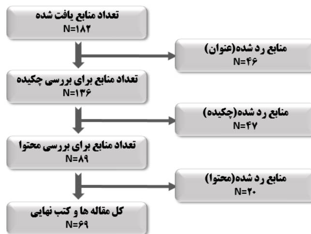
شکل ۲: فرایند جستجو و گزینش کتب و مقاله‌های مرتبط در مطالعه حاضر

در گام سوم تحت عنوان «جستجو و انتخاب کتب و مقاله‌های مرتبط» و در فرایند جستجو، پژوهشگر پارامترهای مختلفی نظیر عنوان، چکیده، واژه‌های کلیدی و محتوا و نظایر آن در زمینه بررسی کیفیت پژوهش‌های مرتبط را در نظر گرفته و کتب و مقاله‌هایی را که با سؤال و هدف پژوهش تناسبی نداشته‌اند را حذف نموده است. همچنانکه در شکل ذیل ملاحظه می‌گردد در مرحله آغازین غربالگری، از میان ۱۸۲ مقاله شناسایی شده، ۴۶ مقاله یافت شده که دارای عنوان و موضوعی متفاوت نسبت به موضوع خاص مورد بررسی در این مطالعه بود، حذف گردید در مرحله دوم و از طریق مطالعه دقیق چکیده و تعیین اینکه یافته‌های به دست آمده در آن پژوهش، ارتباطی با حوزه مطالعاتی این تحقیق نداشته است، نیز ۴۷ مقاله حذف گردید. لذا در این مرحله، ۸۹ مقاله به منظور بررسی میزان همخوانی محتوایی با حوزه مورد مطالعه در تحقیق حاضر و در نتیجه ارائه اطلاعات پیرامون سؤالات این پژوهش، به طور کامل مورد بررسی و ارزیابی قرار گرفت و ۲۰ مقاله دیگر حذف گردید و در نهایت، ۶۹ مقاله مناسب تعیین و در این مطالعه، مورد تجزیه و تحلیل و استفاده قرار گرفت.