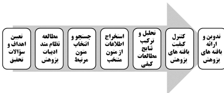
شکل ۱: مراحل هفتگانه الگوی فراترکیب ساندوسکی و باروسو (۲۰۰۷)

روش فراترکیب ۱ ، یکی از مجموع روش‌های فرامطالعه ۲ است. توضیح آن که روش فرامطالعه به معنای بررسی، ترکیب و تحلیل نظام‌مند پژوهش‌های گذشته و یکی از روش‌های تحقیق کیفی پرکاربرد است که امروزه توسط پژوهشگران و مدیران، بسیار مورد توجه و استفاده قرار گرفته است. روش فرامطالعه در حقیقت مشتمل بر چهار روش: الف) فراتحلیل ۳ ، ب) فراروش ۴ ، ج) فراترکیب ۵ و د) فراترکیب تعریف می‌گردد (Bench and Day, 2010). روش فراترکیب یا متاسنتز یک روش تحقیق کیفی است که به پژوهش درباره پژوهش‌های دیگر یا به تعبیری دیگر، به ارزشیابی تحقیقات گذشته می‌پردازد و از آن، تحت عنوان ارزشیابی ارزشیابی‌ها نیز یاد می‌شود. در حقیقت فراترکیب فرایند جستجو، ارزیابی، ترکیب و تفسیر مطالعات گذشته در یک حوزه خاص است. به تعبیری دیگر، فراترکیب مطالعه‌ای کیفی به منظور تفسیر نتایج تحقیقات پیشین و تولید و کاربرد دانش، از این طریق است (Sandelowski and Barroso, 2007). همچنانکه در شکل ذیل ملاحظه می‌گردد در این مطالعه و به منظور بهره‌گیری از روش فراترکیب از الگوی هفت مرحله‌ای ساندوسکی و باروسو (۲۰۰۷)، استفاده شده است.